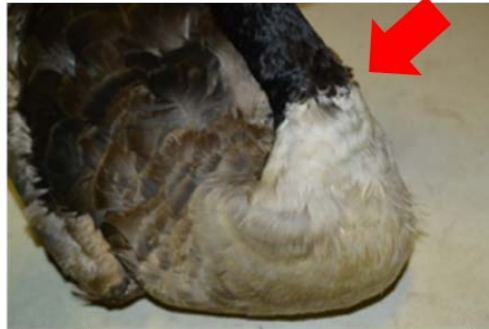
首の付け根に白い輪はない